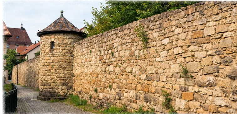
Ein Teil der alten Stadtmauer von Leimen.

Die Stadtmauer von Leimen zeigt, wie das Dorf früher geschützt wurde. Sie ist ein Stück Geschichte und macht unsere Stadt besonders.